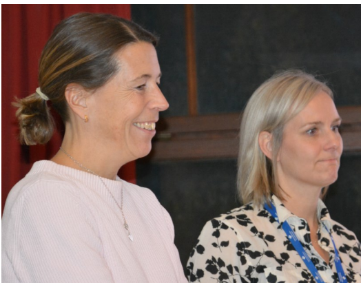
Två av planerarna från Akademiska sjukhuset medverkade.

En stor och dyrbar nybyggnation behövs. Var och hur ligger i politikernas händer att avgöra!