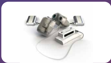
Svenska Realheart utvecklar världens första artificiella fyrkammarhjärta

Till att börja med är storleken på utrustningen ett problem. Tillbehören som bärs utanpå kroppen är tunga och har en kort batteritid. Hjärt-pumpen ger också ifrån sig ett högt ljud. I praktiken blir patienten nästintill bunden till hemmet. Dessutom är livshotande biverkningar som blödningar, anemi och stroke vanliga som en följd av hur hjärt-pumpen hanterar blodet.